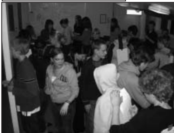
"Oändligt många unga"