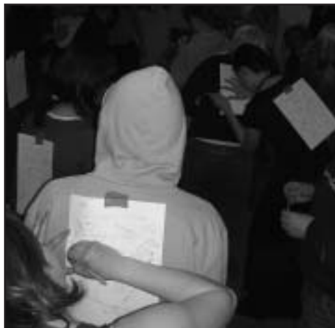
Räcka till för någon enda (se s4-6)

För en sekund såg jag framför mig upp- lägget att helt enkelt bara få skriva om hur bra jag är. Men det är jag ju inte. Inte så bra som jag skulle vilja, och än mindre än vad jag borde.