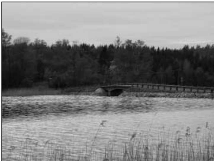
Klövbron som förbinder öster med väster och människa med människa