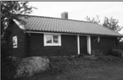
Ryggåsstuga