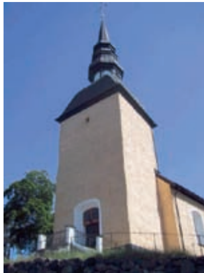
Björnlunda kyrka med det nuvarande tornet och tornspiran som byggdes 1660.

Björnlunda kyrka till exempel har byggnadsdelar från slutet av 1100-talet. Då som nu var kyrkan beroende av församlingsbornas goda vilja. Vid en tornbyggnadsperiod på 1400-talet tillkom tornet som dock brann under 1500-talet. Man tror att kyrkan täcktes provisoriskt under en period fram till 1649. Då slog någon näven i bordet och befallde kyrkvårdarna att inköpa en ”insamlingsbok för fromt kyrkfolk för klockornas och